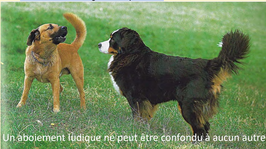
Un aboiement ludique ne peut être confondu à aucun autre